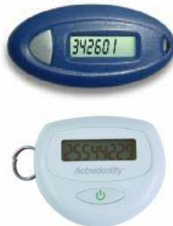
Внешний вид OTP-токена (может различаться в зависимости от модели устройства)

OTP-токен обеспечивает гарантированное получение одноразового пароля. Вы можете приобрести OTP-токены в том количестве, в котором это диктуется удобством и порядком работы организации.